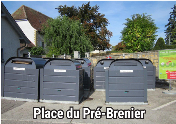
Place du Pré-Brenier

Recycler aux EcoPoints : Papier, carton, verre, aluminium et boîte de conserve en fer blanc.