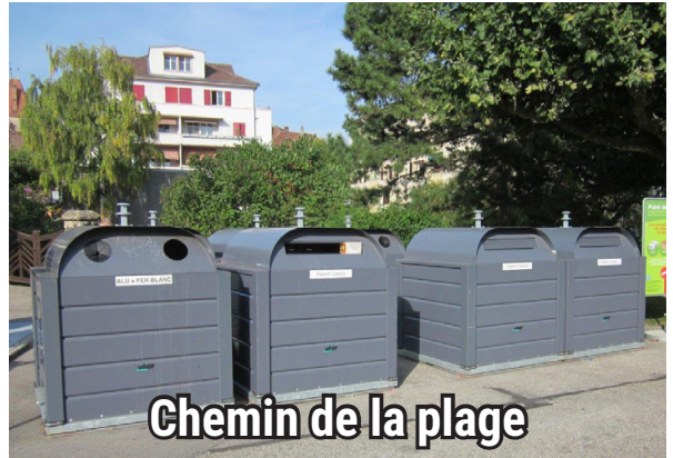
Chemin de la plage