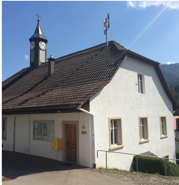
Bâtiment communal / école enfantine