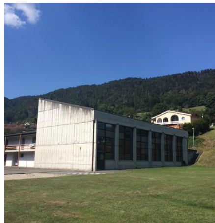
Halle de gymnastique